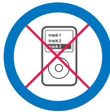
Uidheam eileagtronaigeach leithid cluicheadair MP3, iPod, tablet no smartwatch