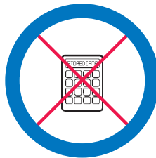
Àireamhair — ach a-mhàin ann an cuspairean sònraichte