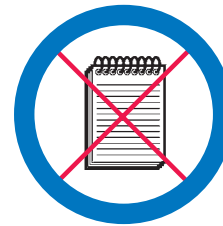
Leabhar, notaichean, sgeidsichean no pàipear