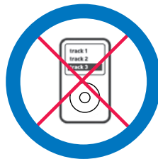
Uidheam eileagtronaigeach leithid cluicheadair MP3, iPod, tablet, smartwatch no inneal sam bith eile a cheanglas ris an eadar-lìon no a thasgas fiosrachadh